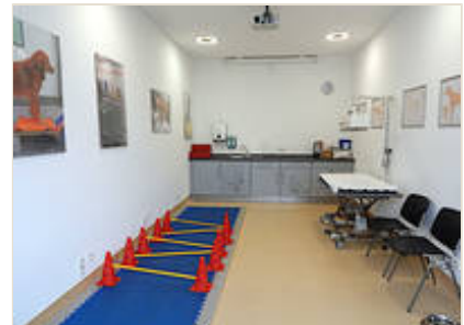
Raum 1: Hier finden alle manuellen und physikalischen Therapien sowie die Bewegungstherapie statt.

Eine enge Zusammenarbeit zwischen Tierarzt, Tierphysiotherapeut und Patientenbesitzer ist uns wichtig, um den bestmöglichen Erfolg für unsere Patienten zu erzielen.