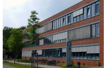
Klinikum am Bünteweg

Hier, wie in den anderen Bereichen zur Erkennung und Behandlung von Erkrankungen, kommen den Klinikpatienten direkt die im Rahmen der klinischen Forschung erzielten Fortschritte zugute. Endoskopische Untersuchungen werden in einem eigens dafür ausgestatteten Raum durchgeführt. Der gesamte OP-Trakt ist, aus hygienischen Gründen, durch Schleusen vom Rest der Klinik abgetrennt.