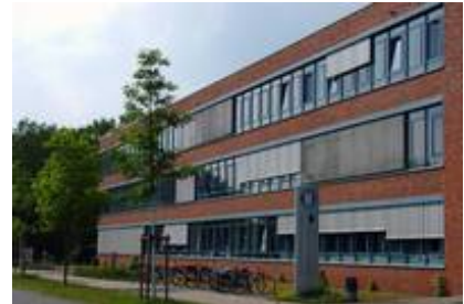
Klinikum am Bünteweg

Hier, wie in den anderen Bereichen zur Erkennung und Behandlung von Erkrankungen, kommen den Klinikpatienten direkt die im Rahmen der klinischen Forschung erzielten Fortschritte zugute. Endoskopische Untersuchungen werden in einem eigens dafür ausgestatteten Raum durchgeführt. Der gesamte OP-Trakt ist, aus hygienischen Gründen, durch Schleusen vom Rest der Klinik abgetrennt.