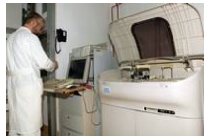
Arbeit am Analysenautomaten

Das Labor ist mit modernster Technologie für die Durchführung eines weiten Spektrums an Analysen ausgestattet, wie sie auch in der Humanmedizin verwendet wird. Tägliche Qualitätskontrollen aller Analyseautomaten stellen die Zuverlässigkeit der Messergebnisse sicher, ebenso wie die ständige Fortbildung unserer Laborkräfte. Die vorhandenen Geräte umfassen Zellzähl- und -differenzierungsautomaten (Advia 120), Mikroskope mit Fluoreszenzeinrichtung, einen klinisch-chemischen Analysenautomat, Photometer, trockenchemische Analysengeräte, Geräte für die Messung von Blutgasen und Elektrolyten, einen Gerinnungsautomaten und Koagulometer für Blutgerinnungsuntersuchungen und diverse Geräte für die Analyse der Blutplättchenfunktion, Elektrophoresegeräte zur genaueren Untersuchung von Proteinen in Blut und Harn, ein Durchflusszytometer für die nähere Charakterisierung verschiedener Blut- und Gewebezellen sowie ein Infrarotspektrometer für die Analyse von Harnsteinen.