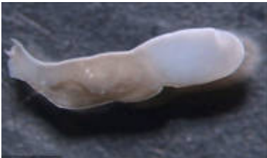
Der Spulwurm Alaria alata .

Wissenschaftler untersuchen heimische Raubtiere auf Infektionskrankheiten und die Ansteckungsgefahr für den Menschen