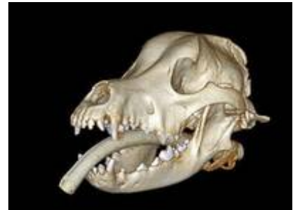
Computertomographische 3D Darstellung eines Schädels

Die Behandlung dieser Erkrankungen ist vielfältig und richtet sich nach der Ursache der einzelnen Erkrankung sowie dem individuellen Patienten. Je nach Erkrankung können Antibiotika, Antiparasitika, Kortikosteroide oder andere Medikamente zur Beeinflussung des Immunsystems zur Anwendung kommen. Die Therapieoptionen werden intensiv mit dem Patientenbesitzer besprochen und erklärt. Bei schwerwiegenden Erkrankungen (bspw. schwerer Lungenentzündung) kann eine intensivmedizinische Behandlung notwendig sein.