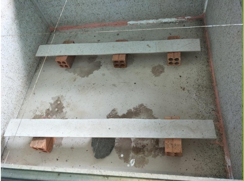
លក្ខណៈ:ទ្រុងស្មាតប៉ត