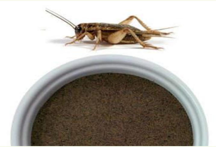
ធ្វើជាម្សៅ