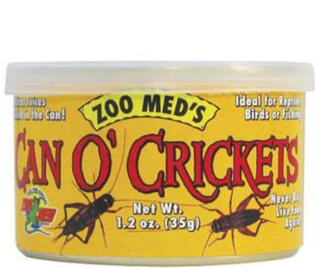
អាហារកំប៉ុង