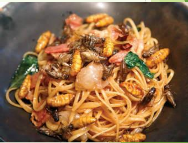
អាហារកែច្នៃ