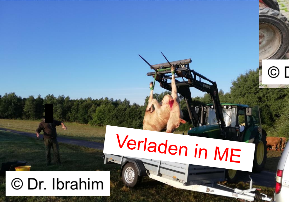
Verladen in ME