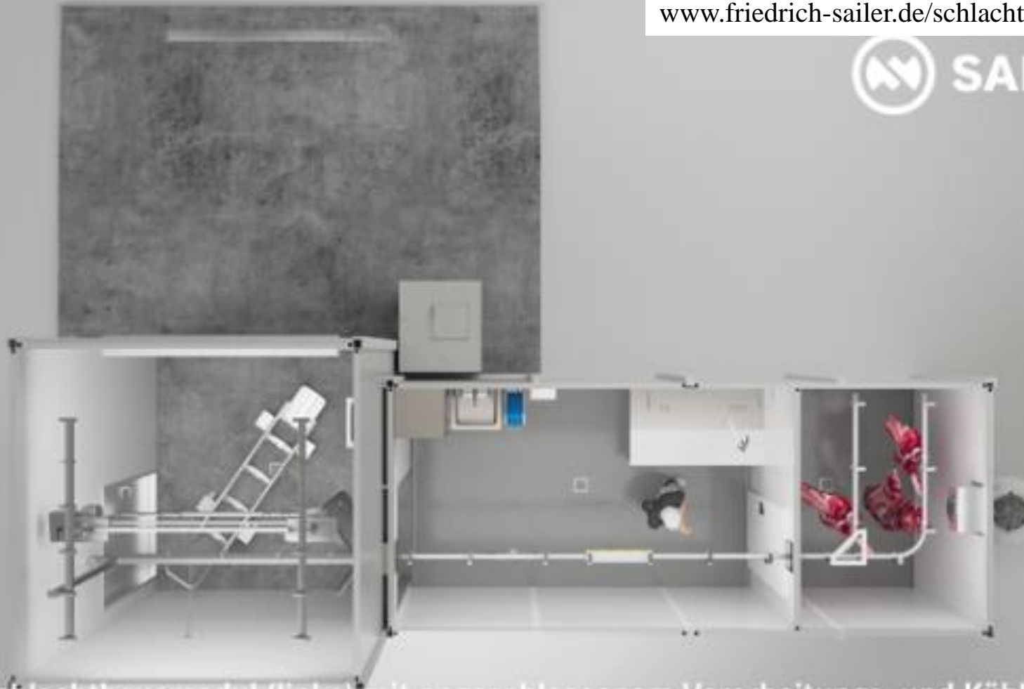
Sailer Schlachthausmodul (links) mit angeschlossenem Verarbeitungs- und Kühlraum