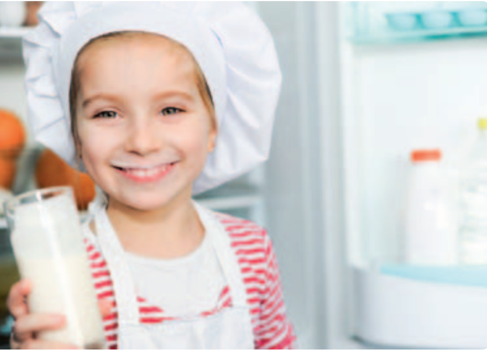
Milch als Getränk: Der Geschmack und die Inhaltsstoffe von Milch können sich durch die Hitzebehandlung und die Lagerzeit verändern.