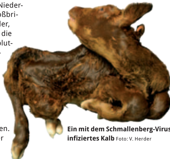
Ein mit dem Schmallenberg-Virus infiziertes Kalb

Die Forscher haben zudem herausgefunden, welche Faktoren des Schmallenberg-Virus für die Virulenz zuständig sind, indem sie höher und niedriger virulente Mutanten des Virus entwickelt haben. Sie fanden heraus, dass ein virales Nicht-Strukturprotein die Virulenz beeinflusst, indem es die Interferonsynthese der befallenen Zellen verhindert und somit in den Abwehrmechanismus der Zelle eingreift. Interferone sind Proteine und haben eine antivirale Wirkung. Indem das Virus die Produktion der Interferone unterdrückt, kann es sich besser vermehren. ■ ml