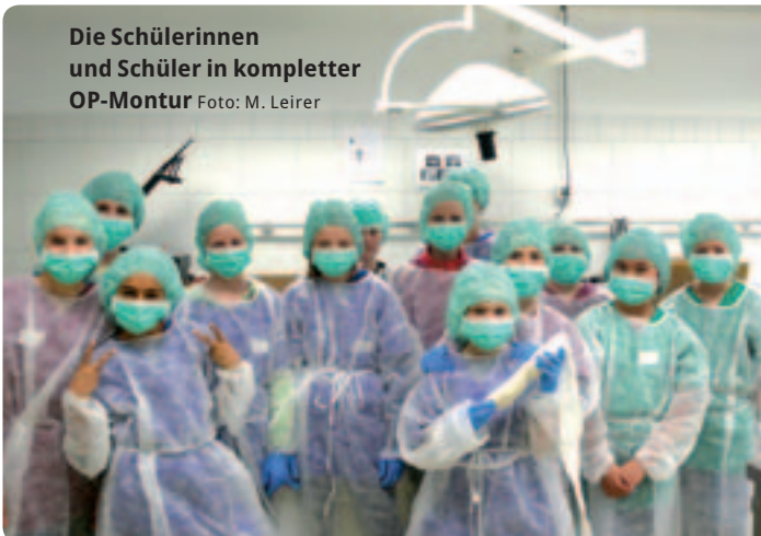
Die Schülerinnen und Schüler in kompletter OP-Montur