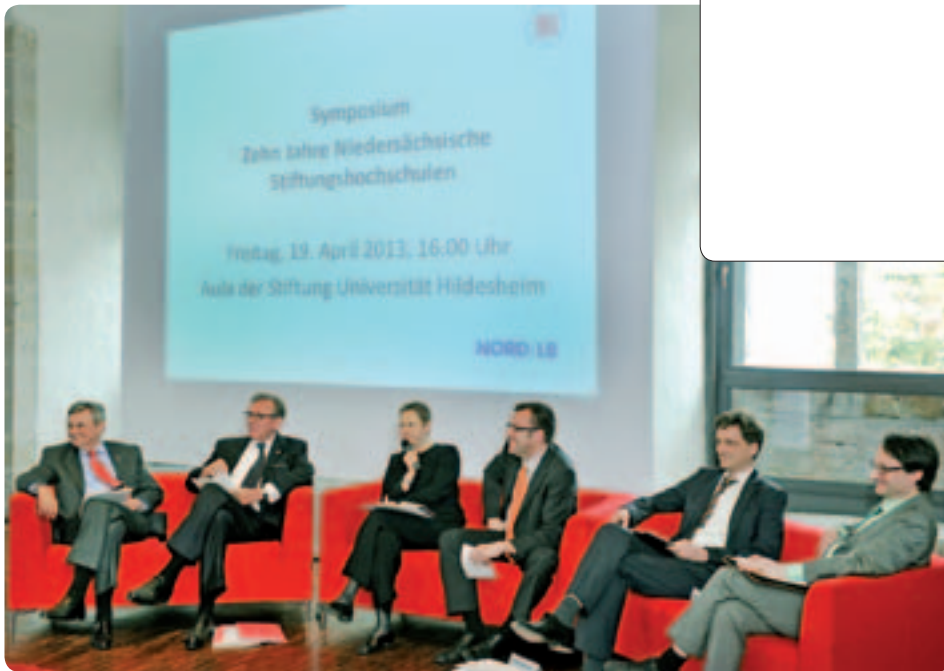
Feld für Adressaufkleber