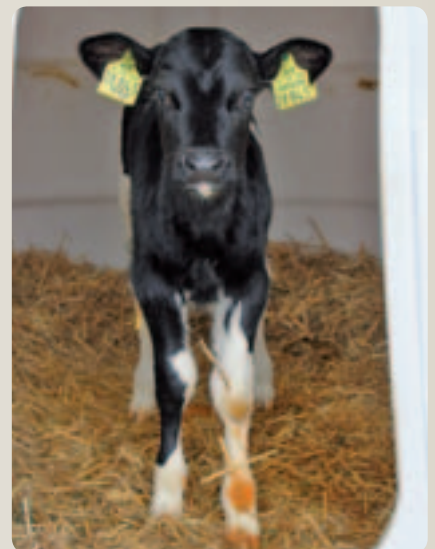
Die beiden Kuhkälber, ungefähr eine Woche nach ihrer Geburt