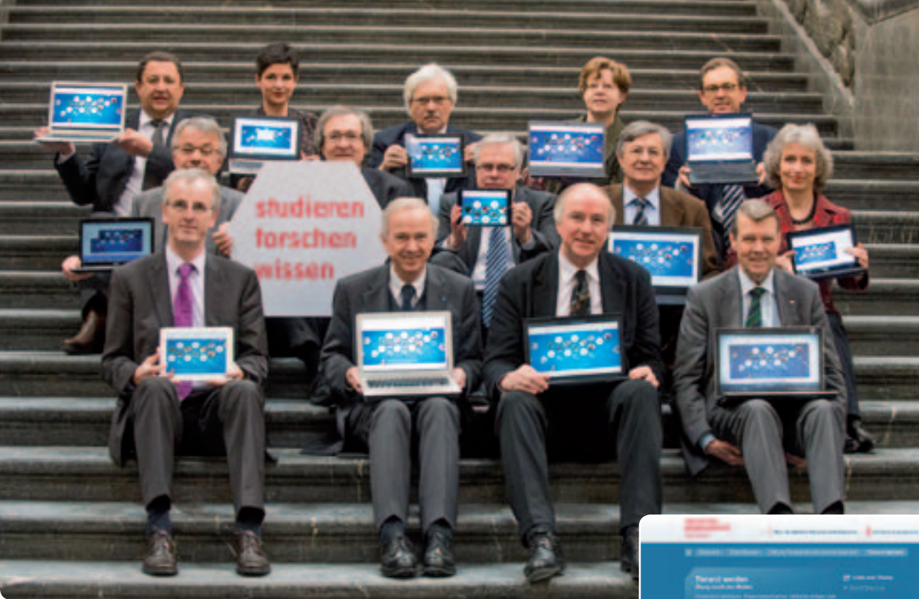
Die Partner der Initiative Wissenschaft Hannover präsentieren zum Onlinestart das Multimediaportal.