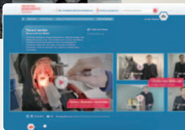
Klicken und Anschauen: So sieht das Portal aus.