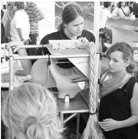
Die Exponate, mit denen die TiHo über veterinärmedizinische Berufsbilder informierte, kamen gut an

mittels E-Learning-Methoden über die vielfältigen Berufsmöglichkeiten informiert, die Tierärzten/innen nach ihrem Studium zur Verfügung stehen. Unter anderem konnten sich die Schüler/innen mit Casus-Fällen über die verschiedenen Berufsbilder informieren.