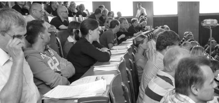
Die Fortbildung war so gut besucht, dass am zweiten Veranstaltungstag ein größerer Hörsaal her musste