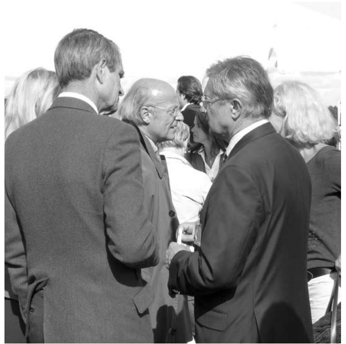
Zeit für gute Gespräche

Der Renntag der Landwirtschaft zeichnet sich durch ein breites Begleitprogramm für die Besucher/innen aus – eine gute Gelegenheit für die TiHo sich mit einem Stand zu präsentieren und über das Leistungsspektrum der Klinik für Pferde zu informieren. Rund um die Uhr standen Tierärztinnen und Tierärzte aus der Klinik für Fragen jeder Art zur Verfügung und informierten über die Arbeiten in der Klinik.