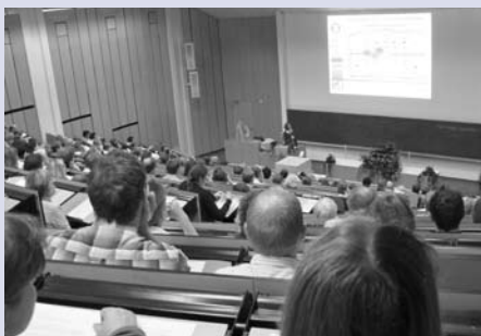
Tendenz steigend: Jedes Jahres kommen mehr Teilnehmer/innen zu der Tagung „Aktuelle Probleme des Tierschutzes“

Fast 300 Tierärzte/innen, Tierhalter/innen, Juristen/innen und Biologen/innen waren sich einig: Tiere sind kein Spielzeug und keine Sachen. Der Tierschutz-erziehung muss schon in den Schulen mehr Raum gegeben werden. Das Schwerpunktthema der diesjährigen Tierschutztagung am 10. und 11. September 2009 an der TiHo war „Aktuelle Probleme des Tierschutzes – Tierschutz geht in die Schule“.