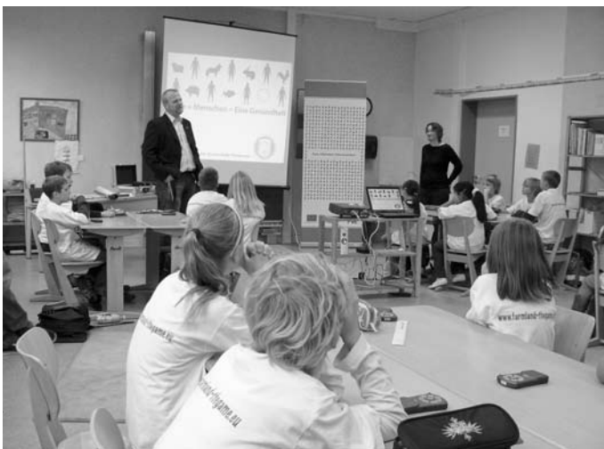
Die Schülerinnen und Schüler nahmen begeistert an der Veranstaltung teil

selbotschaft ist, dass Tierkrankheiten einen immer stärkeren Einfluss auf die Volksgesundheit haben und hohe Tiergesundheitsstandards sich auch positiv auf den Menschen auswirken. Im Laufe dieser Europäischen Veterinärwoche werden in allen EU-Ländern Veranstaltungen zu dem Thema angeboten. Die TiHo hat sich mit einer Schulaktion beteiligt. Ziel war es, Kinder früh für die Problematik zu sensibilisieren und zu vermitteln, dass Krankheiten an Landesgrenzen nicht halt machen.