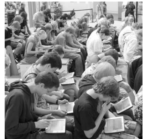
In zwei Durchgängen nahmen rund 150 Schüler/innen an der E-Klausur auf der Ideen-Expo teil