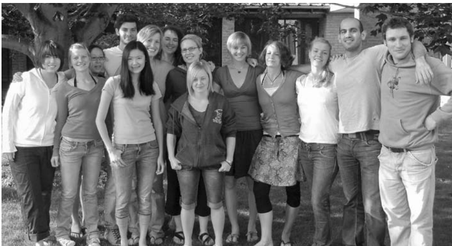
Die Teilnehmer/innen der Cambridge Summer School

School, andere in der Biochemie. In der Regel hatten sie zweimal in der Woche Seminare zu bestimmten Themen wie zum Beispiel: wissenschaftliches Schreiben, Berufswege, Epidemiologie, aber auch spezifische Fachthemen wie Influenza oder Tuberkulose. Den Rest der Zeit verbrachten sie im Labor. Am Ende der Summer School musste jeder zu seinem Projekt einen 25-seitigen Bericht anfertigen und eine Präsentation vorbereiten, um der Arbeitsgruppe Rede und Antwort zu stehen.