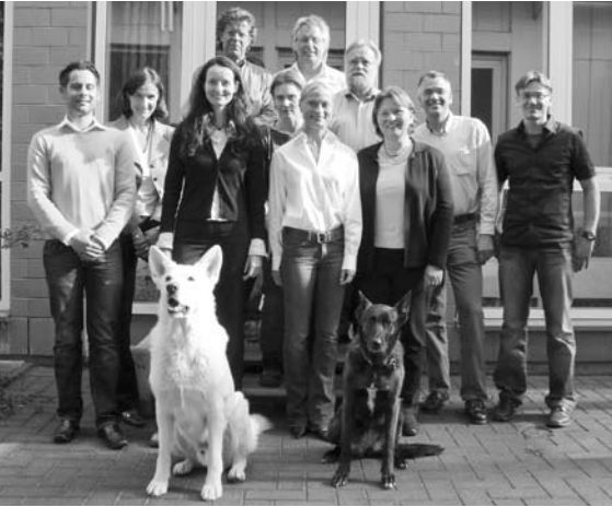
Die DFG-Forscherguppe auf einen Blick

DFG fördert Erforschung von Gehirn- und Rückenmarkserkrankungen des Hundes