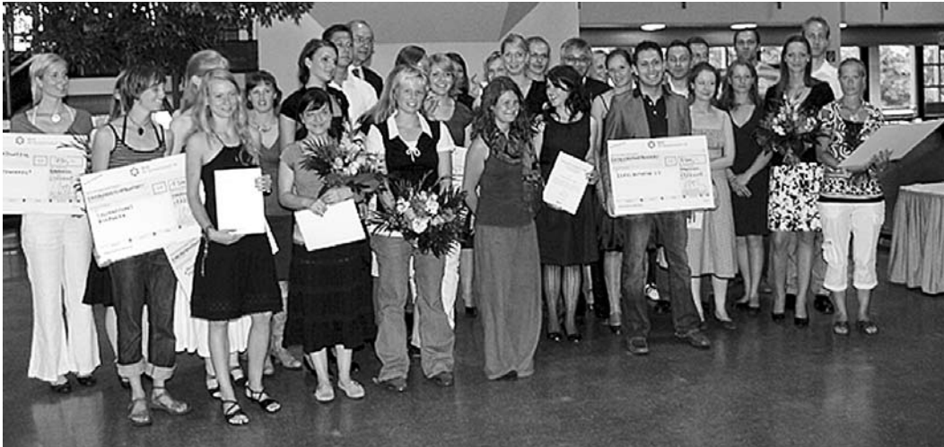
Die Preisträgerinnen und Preisträger des Studentenwerkspreises 2008