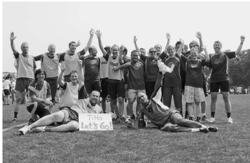
Im Eröffnungsfußballspiel gewannen die Parakliniker gegen die Klinikler mit 1:0

Ein Höhepunkt stellte das Eröffnungsfußballspiel zwischen Klinikern und Paraklinikern aus der TiHo dar. Die TiHo-Dozenten kämpften zweimal zehn Minuten um den Sieg, den sich zum Abpfiff die Parakliniker mit 1:0 sichern konnten. Der von der TiHo-Promovierenden ProV gestiftete Pokal wird bis zur Revanche im nächsten Jahr im Anatomischen Institut stehen. Nach dem Eröffnungsspiel kämpften verschiedene Mannschaften beider Hochschulen um die Siege bei einem Fußball- und einem Volleyballturnier. Beim Volleyball konnten die „Schmetterlinge“ der TiHo, beim Fußball die „11 Freunde“ der MHH triumphieren. Außerdem gingen am Maschsee neun tapfere Langläufer über sechs und zwölf Kilometer an den Start. Gewonnen hat