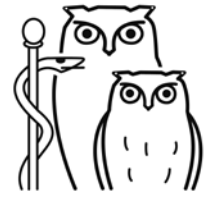
Das neue Logo der GdF