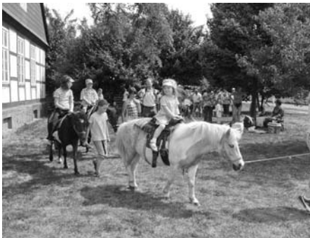
Das Ponyreiten kam bei den jungen Besucherinnen und Besuchern sehr gut an