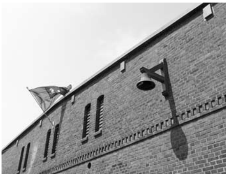
Die neue alte Glocke des Lehr- und Forschungsgutes wurde am Tag des offenen Hofes enthüllt