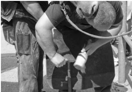
Die Hufschmiede der Klinik für Pferde zeigten ihr Können

Christian Wulff und Hans-Heinrich Ehlen besuchten das Lehr- und Forschungsgut Ruthe