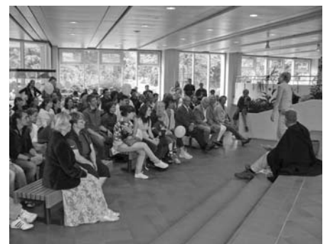
Die Theater-AG der TiHo begeisterte die Sommerfest-Besucher/innen mit einer modernen Rotkäppchen-Fassung

Weitere Fotos vom Sommerfest finden Sie im Internet unter www.tiho-hannover.de/aktuelles/veranstaltungen.htm .