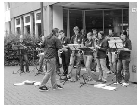
Die Rocking Vets - Bigband der TiHo

Am 20. Juni 2008 fand das Sommerfest der TiHo am Bünteweg statt. Rodeoreiten, TiHo-Theater, Rocking Vets, Fußball, Marktstände, eine Tombola von Tierärzten ohne Grenzen, historische Wiesenpflege und die Band Percussion tonal, es wurde viel geboten in diesem Jahr.