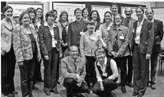
Die Teilnehmerinnen und Teilnehmer der ersten Fortbildung „Professionelle Lehre“

Nach einer kurzen Vorstellung wurden die Zuhörerinnen und Zuhörer in das Programm einbezogen: In kleinen Gruppen sollten sie auf Moderationskarten zusammentragen, was sie unter guter Lehre verstehen. Es wurde sogleich intensiv diskutiert: Ein sicht- und hörbares Zeichen dafür, dass die aktive Beteiligung des Auditoriums in besondere Weise das Interesse weckt und zur Beschäftigung mit dem Thema anregt. Es folgten ein kleiner Exkurs in die physiologischen Vorgänge des Lernens sowie Vorträge über die Vorbereitung einer Lehrveranstaltung und über verschiedene Lehrmethoden. Besonders informativ waren die Poster, auf denen die vielen Themen des Lehrganges vorgestellt wurden. Außerdem gab es Gelegenheit,