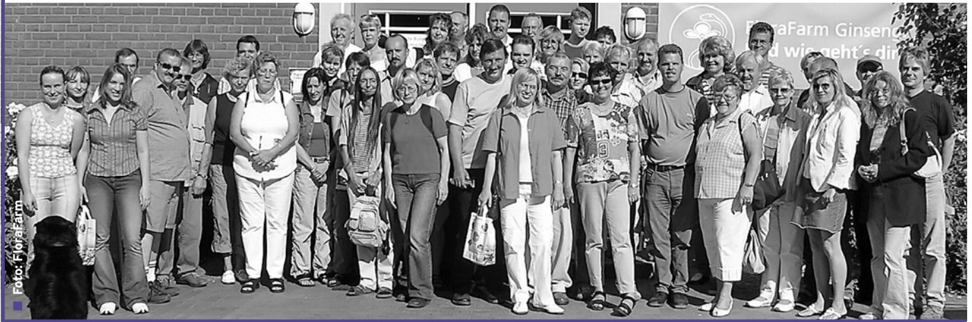
Hochschulausflug der TiHo

Hochschulausflug zur FloraFarm und in den Vogelpark Walsrode