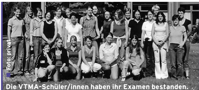
Die VTMA-Schüler/innen haben ihr Examen bestanden.

Bisher wurde das „Grüne Klassenzimmer“ im 2-jährigen Turnus nur zum Tag des offenen Hofes angeboten. Wegen des großen Interesses soll es zukünftig jedes Jahr stattfinden. Der nächste Tag des offenen Hofes findet im Jahr 2006 statt.