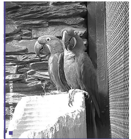
Im Vogelpark Walsrode

„Alles in allem ein hoch interessanter Ausflug, der allen Beteiligten viel Spaß gemacht hat“ dankten die Teilnehmer/innen Elisabeth Evers und dem Personalrat für die gute Vorbereitung des Tages.