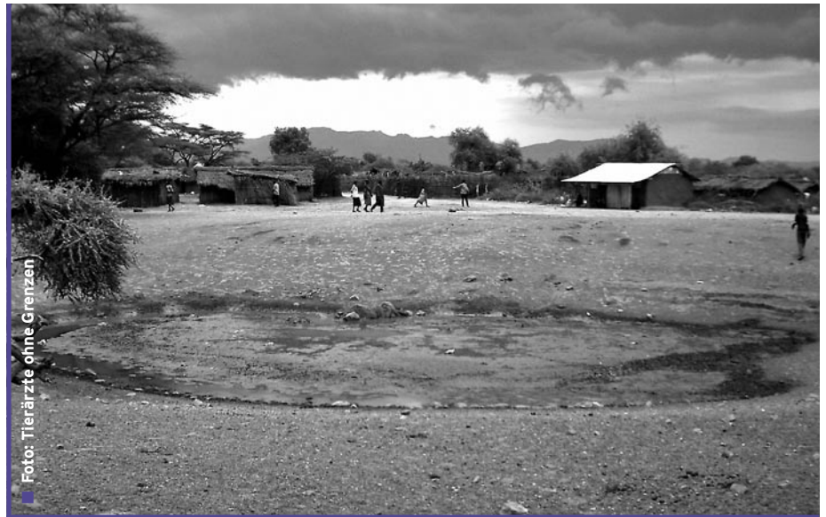
Die Wasserstelle in Narus in ihrem Urzustand

Ebenfalls in Kapoeta führt Tierärzte ohne Grenzen e.V. ein Projekt zur Friedenssicherung durch, um den Frieden auf lokaler Ebene zu stabilisieren. Mobile Theatergruppen bringen wichtige Themen wie friedliche Konfliktlösung, Bildung, Gesundheitsfragen und Tiergesundheit zu den Hirten. Gleichzeitig richtet Tierärzte ohne Grenzen e.V.