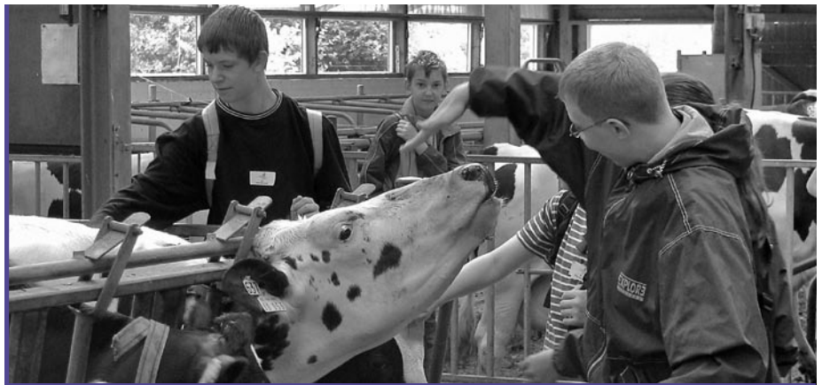
Anfassen erlaubt: Schülerinnen und Schüler auf dem Lehr- und Forschungsgut Ruthe

Landwirte aus der Region haben den Schülerinnen und Schülern ihre Kenntnisse und Erfahrungen erlebnisorientiert und spannend vermittelt. Sie haben ihnen auf anschauliche Weise erklärt, was Kühe fressen, wo die Milch